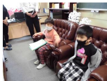
校長室のイスにすわったよ。