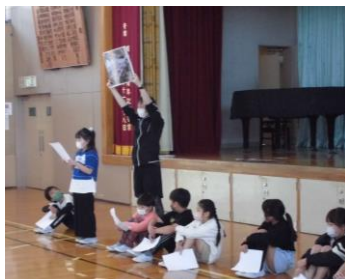
学校のオススメの場所を発表しました