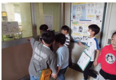
ここが配膳室だよ!