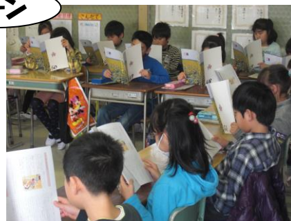
読むときは、教科書を持つ。