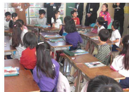
話す人の方を見て聞く。