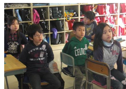
先生の方からだを向けて聞く。